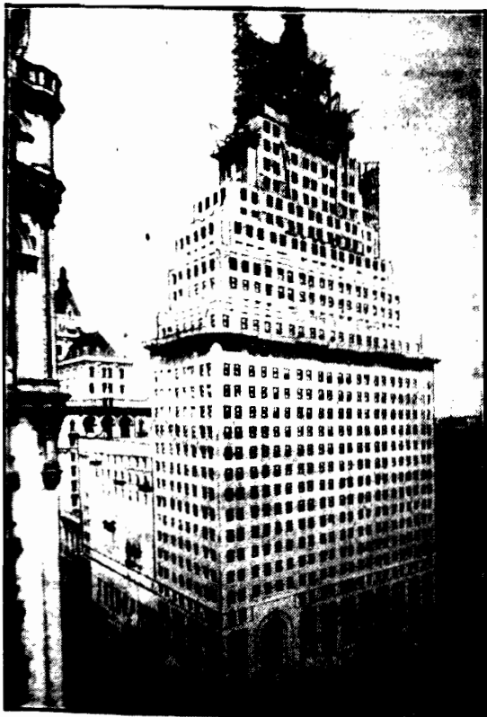
W Nowym Jorku jedno z towarzyszących filmowych szkieletów otrzymał 36-piętrowy drapacz nieba. Znajduje się w nim teatr filmowy o 4.600 miejscach siedzących, oprócz tego otrzymał hale i t. p. „sala narodów” z malarzami i rzeźbiarzami, salami koncertowymi, biblioteką, a także salą dla muzyki.