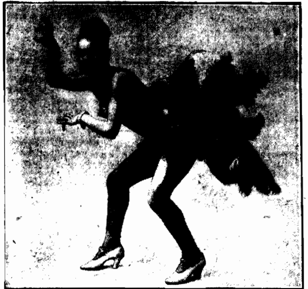
Do Paryża przybyła tancerka oryginalna murzyńska afrykańska, która swymi oryginalnymi produkcjami zachwycała stolicę Francji. Jej tańce bowiem są nierzadziej pierwotne, jakby naśladowane prymitywne rysunki ludzi dzikich. Józefina Baker naśladuje w rytmicznych formach ruchu dzikich zwierząt. W tym stylu właśnie wykonuje ona „tańca strusia”.